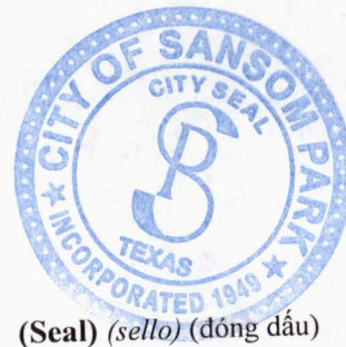
(Seal) (sello) (đóng dấu)

3-3-2022 _____ Date of signing (Fecha de firma) Ngày ký nhận